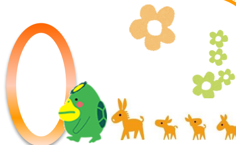
ロバ隊長 「認知症サポーターキャラバン」マスコット

12:30 開場・受付開始 12:50 もの忘れ検診（研修室） 14:00 開演（イベントホール）